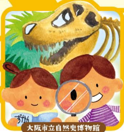
大阪市立自然史博物館