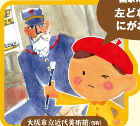
大阪市立近代美術館(仮称) 心斎橋展示室