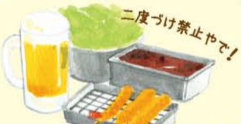
二度づけ禁止やで!