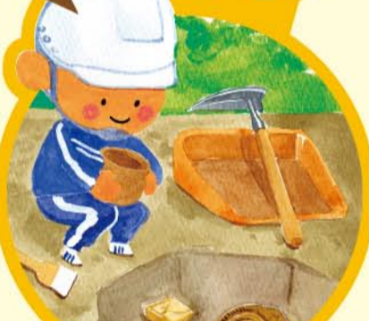
大阪文化財研究所