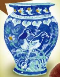
大阪市立東洋陶磁美術館

陶磁器にウツリ...♡ 友達にも見てもらおう! 右どりの人のコマを このマスに連れてくる