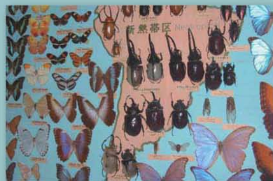
▲世界のチョウ・カブトムシ