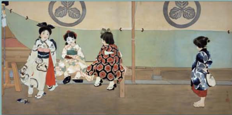
▲島成園 祭りのよそおい 1913年（常設展示はしていません）