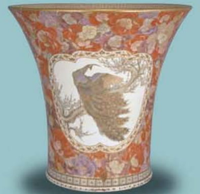
▲藪明山作 上絵金彩富士・藤・孔雀園大花瓶