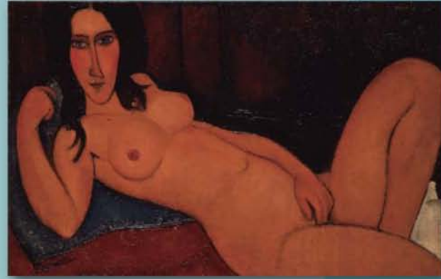
▲アメデオ・モディリアーニ 髪をほどいた横たわる裸婦 1917年（常設展示はしていません）