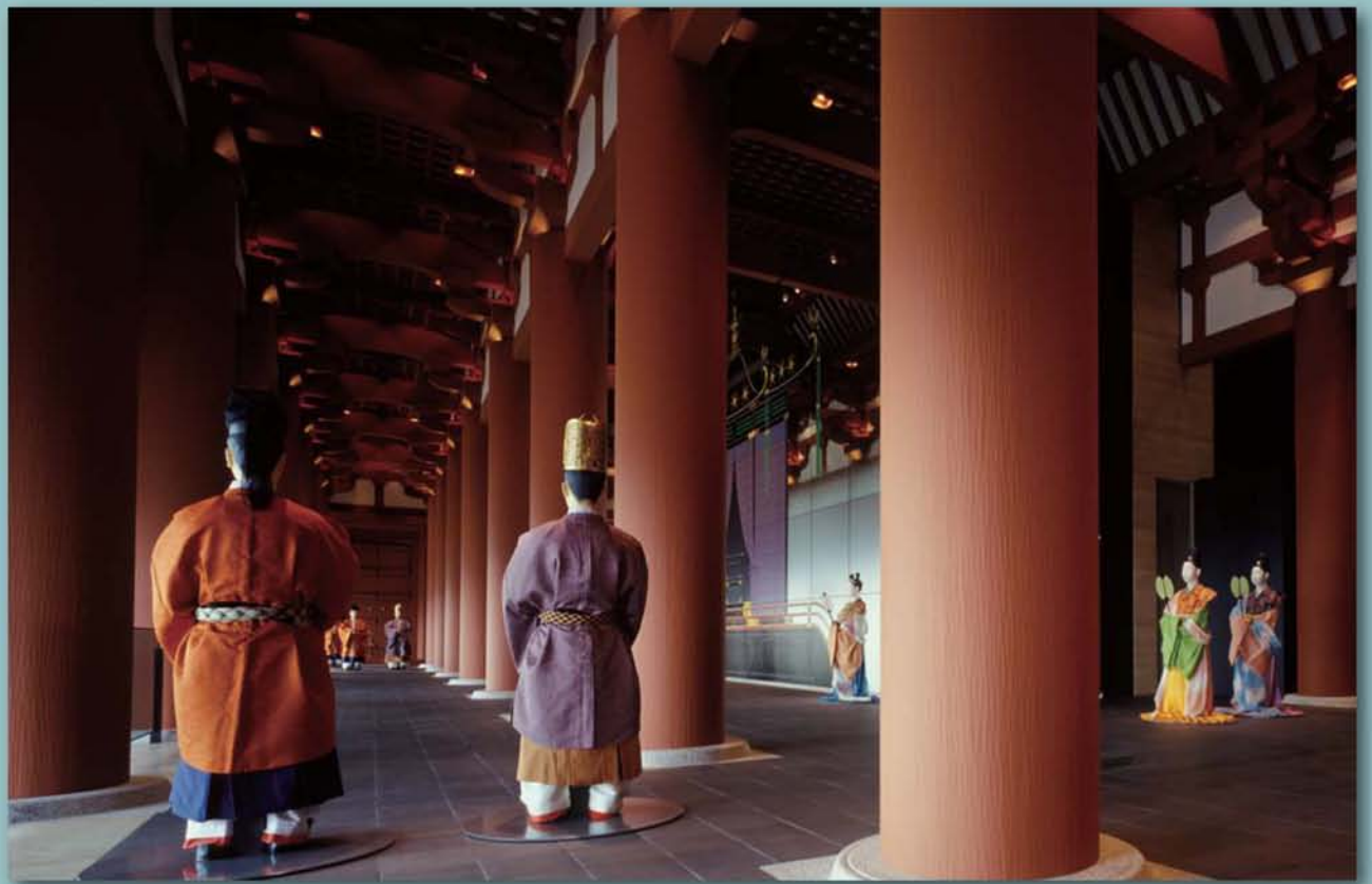
▲古代フロア難波宮の時代