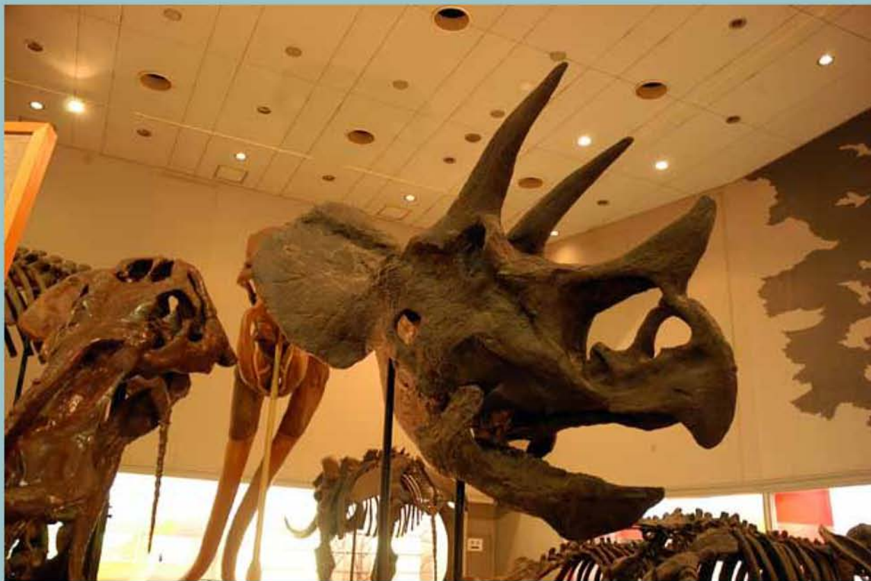
▲トリケラトプス頭骨