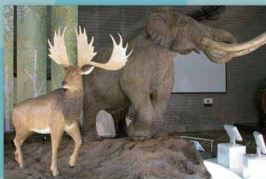
▲ナウマンゾウとオオツノジカの復元像(ナウマンホール)