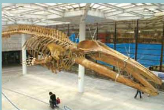
▲ナガスクジラ全身骨格標本(ナガスケ)