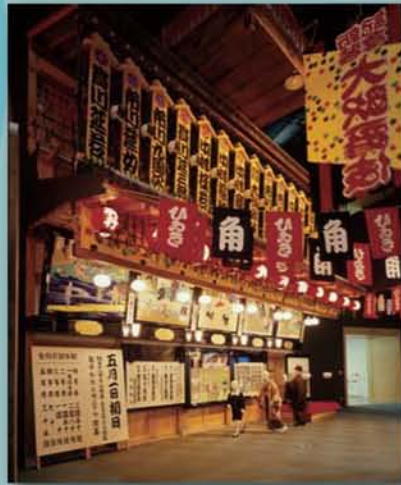
▲近現代フロア大正・昭和の時代