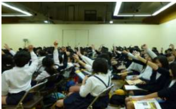
講義室での話し合い

思っていたよりもサイズが小さくて秀吉は小柄な人かなと思いました。秀吉はとても豪華でピカピカしたものが好きなので、その通りとても豪華だった。小柄なのに天下統一を果たした秀吉はすごい！ (小学生)